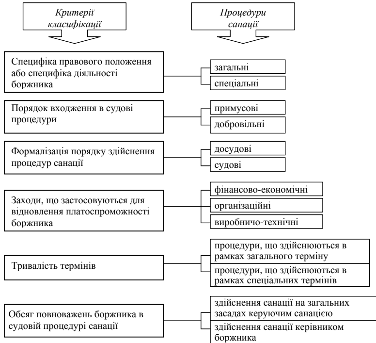
Рис. 1.1. Класифікація процедур санації з правової точки зору

Розглянуті форми та варіанти санації, в основі яких є поєднання тих чи інших можливих типів санаційних заходів, відображають її економічну сутність. На рис. 1.1 представлена класифікація процедур санації з правової точки зору, які пропонують В. Радзивілюк [110] та І. О. Хар [142].