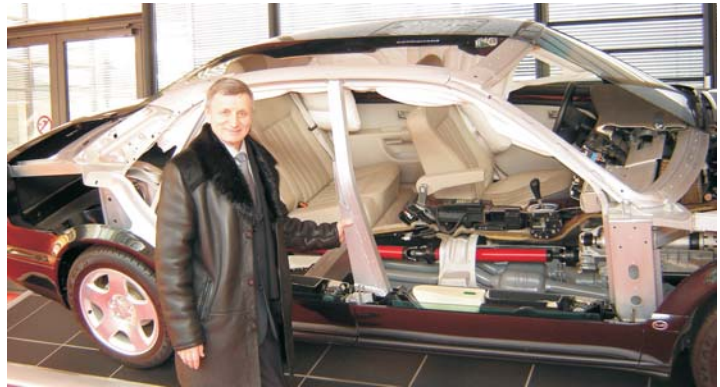
Для студентів – усе! Навіть «Audi-A8 quattro» у розрізі

– Розвиток проектування, конструювання нині пов'язаний із використанням нових комп'ютерних програмних комплексів. Приміром, NOSTRAN. Програма донедавна була засекречена, тому що була створена для потреб NASA та використовувалась для конструювання космічних систем, а зараз вона доступна. Без використання цих сучасних програм нам неможливо конкурувати. Слід у нас створювати інженерні центри розрахунку з використанням цих сучасних програм. До того ж для навчання