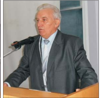
Доктори педагогічних наук, професори Олександр Лавриненко та Микола Солдатенко (Національна академія педагогічних наук України)

бистість. Варт зауважити, що уже майже 20 років в нашому університеті діє Центр культурології і виховання студентів, який нині має цілий ряд різноманітних художніх музеїв, котрі дуже вдало доповнюють гуманітарну складову підготовки фахівців вищої кваліфікації.