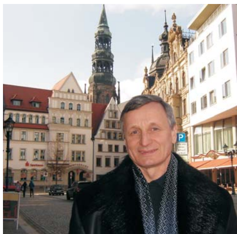
Старовинний центр Цейкау

Західносаксонська вища школа має факультети машинобудування і автомобілів, електротехніки, інформатики, архітектури, мистецтва, текстилю, дизайну, дере-