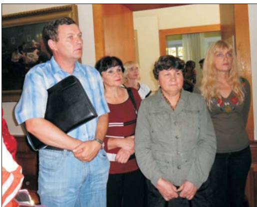
Учасники конференції гостюють у Миколи Пирогова

До початку роботи конференції в університетському видавництві вийшов розкішний фоліант – збірник її матеріалів. А також статті виставлялись на власному сайті конференції за адресою http://conf.vstu.edu.ua/hume/d/ . І, як засвідчує статистика, популярністю конференція ще до її початку користувалась неабиякою.