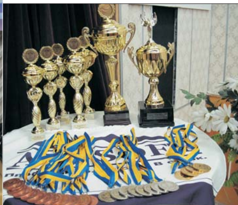
Нагороди чекають своїх власників