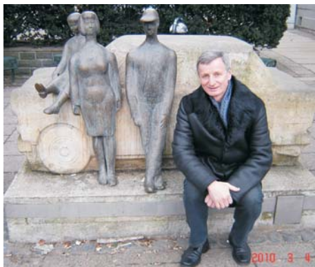
Пам'ятник сімейній автівеці «Trabant»