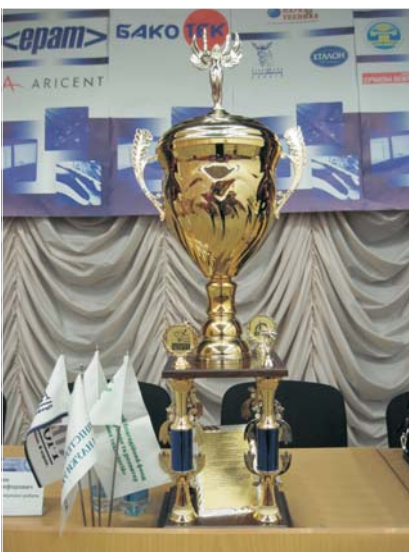
Великий перехідний Кубок поїхав до Києва