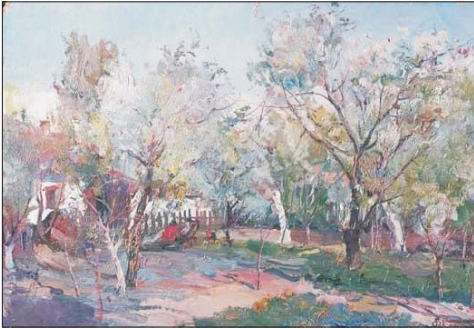
"ЦВІТЕ БОРЩАГІВСЬКА ВУЛИЦЯ. 1948"