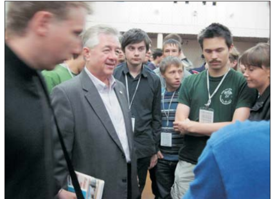
Білл Поучер багато спілкувався з олімпійцями

— Ми щиро вітаємо Білла Поучера в Україні і сподіваємося на позитивне рішення щодо проведення в Україні з