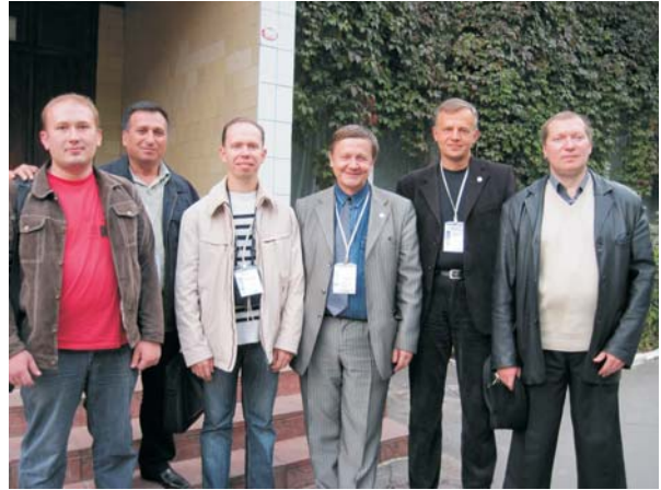
Тренери українських команд програмістів

Цифру 7 багато хто вважає щасливою. Тож, і ми маємо сподівання, що наші хлопці, подорослішавши і набравшись досвіду, наступного вересня на XI Всеукраїнській студентській олімпіаді з програмування покажуть кращий результат – відродять спортивну програмістську славу зіркових студентських команд ВНТУ, які перемігши в Україні і в Європі, двічі змагались за перемогу з найсильнішими програмістами планети. Команда нашого університету двічі була у фіналі