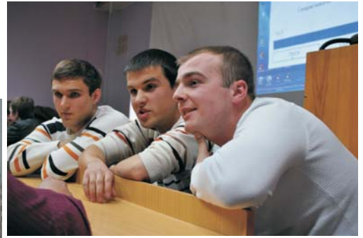
У першому півфіналі бульдозер з факультету автомобілів ІнМТ зруйнував фортецю будівельників, а заодно й систему теплопостачання й газопровід, відправивши команду ІНБТЕГП боротись за третє місце

Святкування золотого ювілею нашого університету не обмежувалось лише заходами 20 квітня, окрім цього були різноманітні виставки, інститутські урочистості, в цьому ряду постали й інтелектуальні змагання з брейн-рингу.