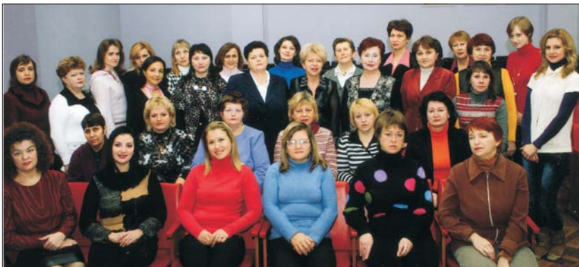
Колектив університетської бібліотеки

Бібліотека сьогодні – не тільки зібрання книг, але й мозковий осередок університету, який перебуває в центрі академічного життя.