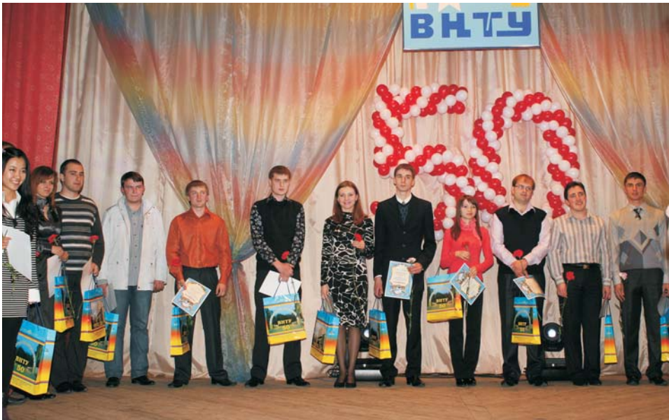
Гордість університету – магістри

та Африки, а тому має високий імідж в цих країнах, особливо після виконання нами масштабних освітніх проєктів в консорціумах з багатьма університетами Федеративної Республіки Німеччини, Франції, Італії, Данії, Швеції, Іспанії, Португалії і Великобританії, завдяки чому провідні європейські фірми з задоволенням нам поставляють безкоштовно своє сучасне обладнання для оснащення наших навчальних лабораторій, що дозволяє нашим випускникам працювати як у рідній країні, так і за кордоном на сучасному обладнанні без втрат часу на адаптацію, і, як наслідок, диплом нашого університету сьогодні визнається у більшості країн світу, у тому числі і тих, з якими в Україні ще немає договорів про взаємне визнання інженерних дипломів.