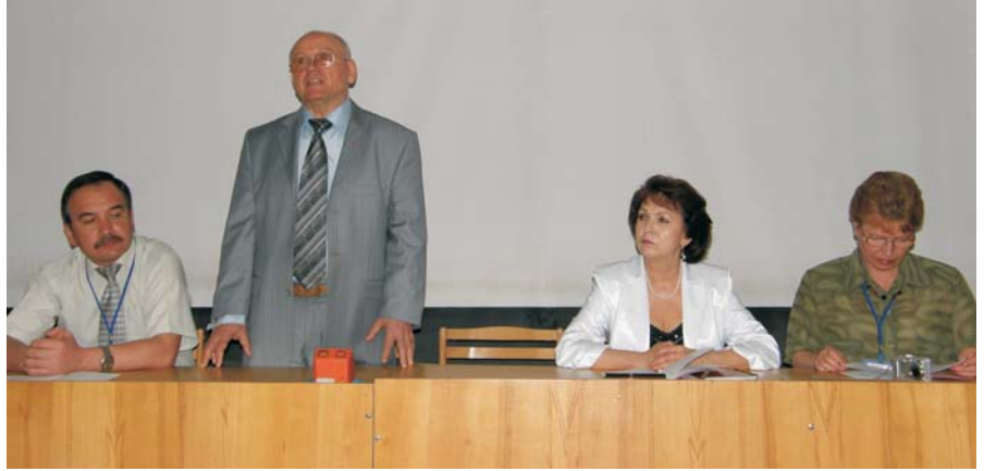
Президія ІХ Міжнародної конференції «Гуманізм та освіта». Голова оргкомітету – ректор ВНТУ, академік Борис Мокін

Кафедра КСПП була і залишається організатором конференцій «Гуманізм та освіта». Але зрозумілим є те, що ефективність і масштабність наших конференцій стає можливою завдяки підтримці і допомозі ректора ВНТУ академіка Б. І. Мокіна, який є постійним головою оргкомітету;