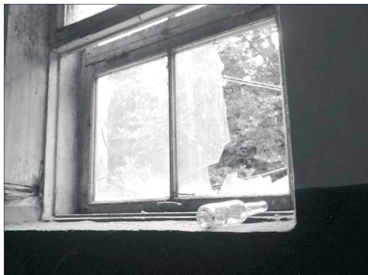
Одеса — Порто-франко, або Вікно в Європу