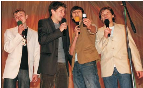
Перспективна «Сесія нездійсненна» Інституту БТЕГП

Підсумовуючи скажу, що з кожною наступною грою наш студентський чемпіонат КВН стає все більш цікавим, дотеп-