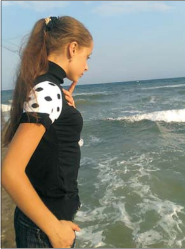
Море і Єлена