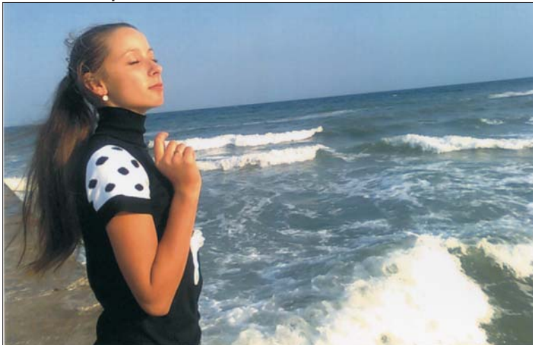
Єлена і море