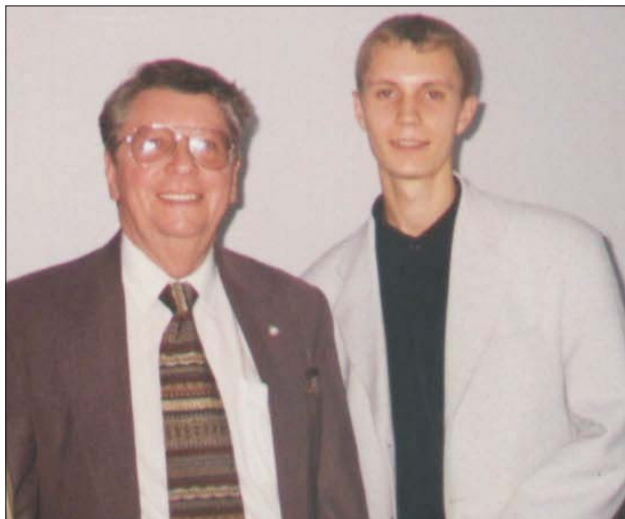
Президент SPIE, маршал NASA Річард Хувер і Андрій Яровий

що він увійшов у каталог «Людина досягнень», який видає Кембриджі.