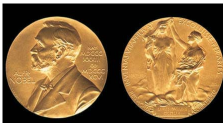
Нобелівська медаль О. Прохорова