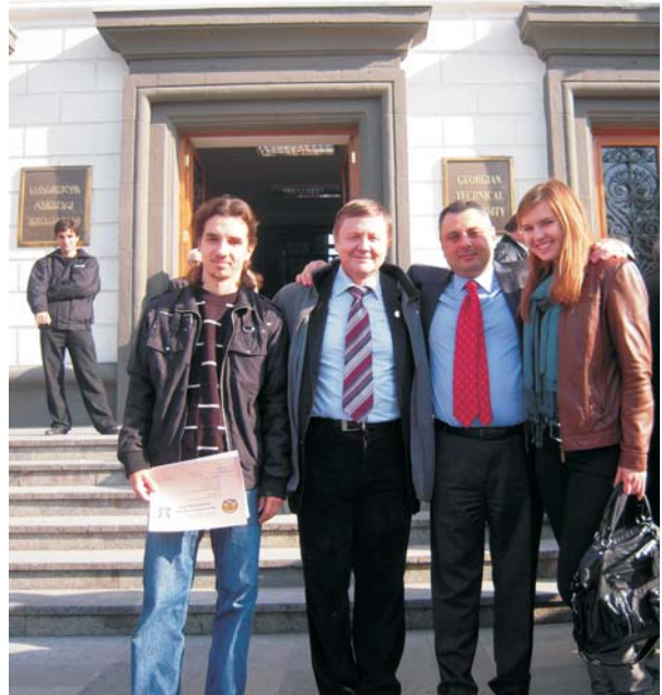
Ректор ГТУ Арчіл Прангішвілі з представниками ВНТУ перед входом у навчальний корпус Грузинського технічного університету

Змагання особистого туру першості Південного Кавказу, які відбулися через день, вже не були такими напруженими, бо не такою була ціна перемоги. І знов усі перші рядки турнірної таблиці за українцями, і в тому ж порядку, що і на командному турі. Але призових місць тут було більше, отож наші хлопці в особистому турі вибороли дипломи другого ступеня.