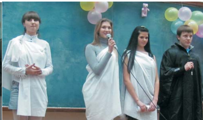
Помпезно привітав першокурсників могутній бог Наук, його шанована свита — богині Електроенергетика та Психологія, а також Муза

конкурсну програму між представниками обох факультетів нашого Інституту ЕЕЕМ. За мету «Царівна» мала: визначити, на якому ж факультеті навчаються найсерйозніші дівчата та найвинахідливіші хлопці.