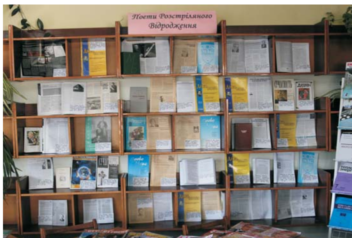
Книжкова експозиція «Поети Розстріляного Відродження»

Активно освоюємо електронні технології, створюємо і надаємо користувачам електронні продукти, адже сьогодні вимагає новітніх форм роботи бібліотеки.