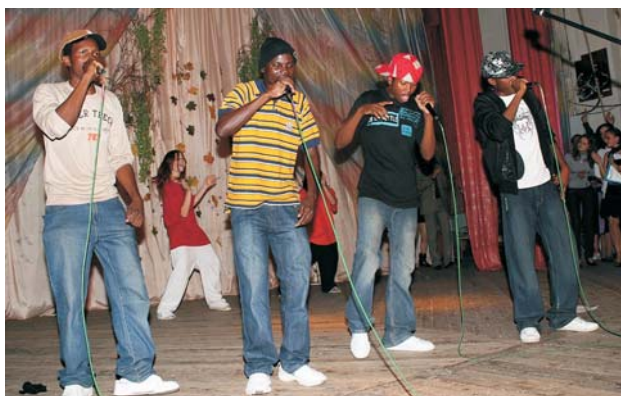
Гурт «E-sir» з піснею «Boomba train» (ІНЕЕЕМ)