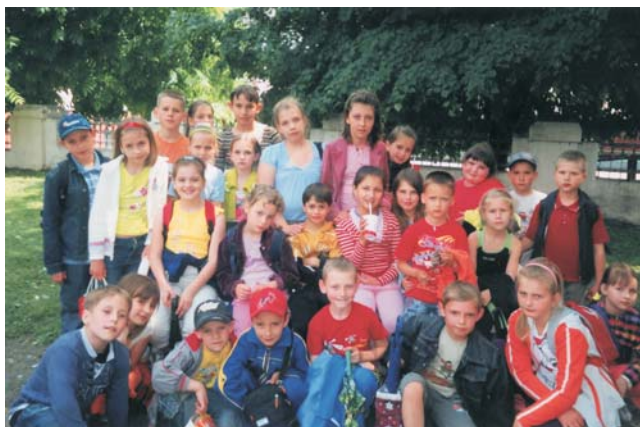
Ми — «живинчата»