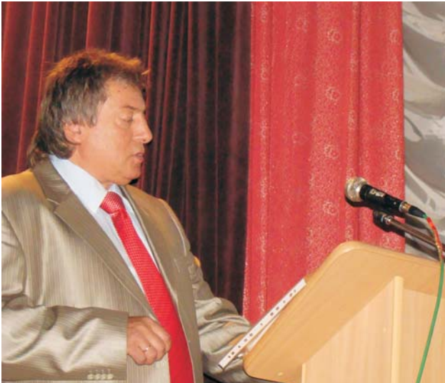
Тричі доктор: геолого-мінералогічних наук, географічних наук, технічних наук Георгій Рудько додає оптимізму у наше майбуття: «Як фахівець стверджую: нафти і газу планеті вистачить ще років на сто»