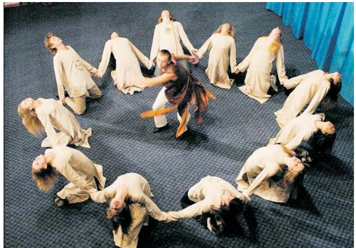
«Лісова пісня» у режисурі Таїсії Славінської зроблена на пластиці і танцях

Гра акторів. Вона просто ВРАЖАЄ! Хіба актори театру і кіно не закінчували один і той же навчальний заклад? Там,