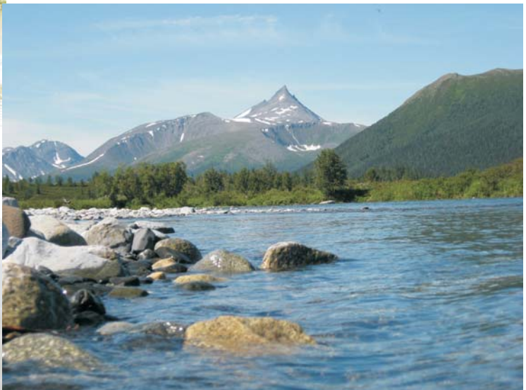
Усі комашині тортури варт перетерпіти задля незрівнянної краси гір і первісної тайги