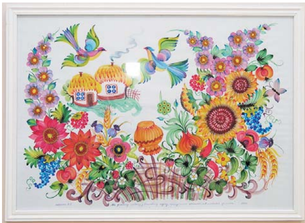
«На зеленому горбочку у вишневому садочку притулилася хатинка, мов маленькая дитинка»

— Вони живуть із своєї творчості. Це мужньо і нині далеко не кожному вдається.