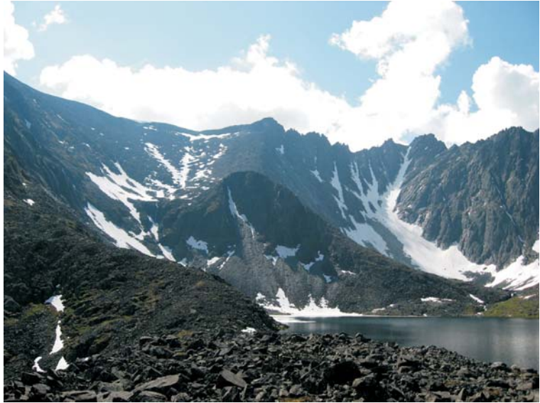
Найменш відвідуваний район Приполярного Уралу – під Свердловом із неповторними прямовисними п'ятисотметровими стінами, вузькими гребенями та безліччю голубих льодовикових озер

Подорож горами Приполярного Уралу Російської Федерації є проміжним кроком для майже усіх туристів-вінничан при переході від походів у «низьких» горах типу Карпат до високогір'я. Цей похід ми планували два роки. Торік через травму одного із членів групи похід довелося відмінити. Проте нині мрії стали реальністю.