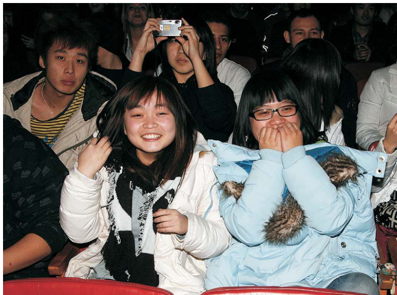
Чути наживо рідну національну музику за тисячі кілометрів від домівки – це просто щастя