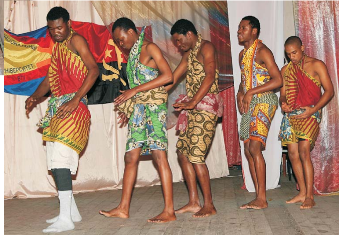
Національний ангольський танець «Кінтуені»

– Я за роки свого навчання навчився не лише розмовляти українською, а й співати. Тому й сьогодні співаємо не рідною таджицькою, а українською.