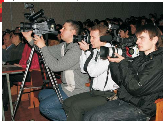
Відеотехніка не встигала за динамікою дійства на сцені

– Молодь – це майбутнє нації. А освічена молодь – це надія нації. Я сподіваюсь, що сьогодні в нашому залі перебуває надія багатьох націй планети!