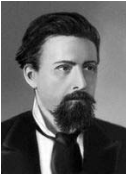
Микола Іванович Кибальчич

Космонавтика — один з наймолодших та найзахопливіших напрямків науково-технічного прогресу. Досягнення українських вчених у цій галузі — світового рівня. Та прикро, що їхні геніальні ідеї не знайшли розуміння ні в Російській імперії, ні у СРСР, який зацікавився цими дослідженнями лише тоді, коли ними в всерйоз зайнялися США.