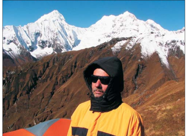
Південна Аннапурна. Межа обледеніння 4300 м — вічні льоди, зона снігів

коли присмоктується. Нижче 4 тисяч метрів з ними просто біда. А далі їх немає. Зате виникає інша проблема — вище 4000м киснева недостатність спричинює гірську хворобу, тож, ми приймали спеціальні препарати.