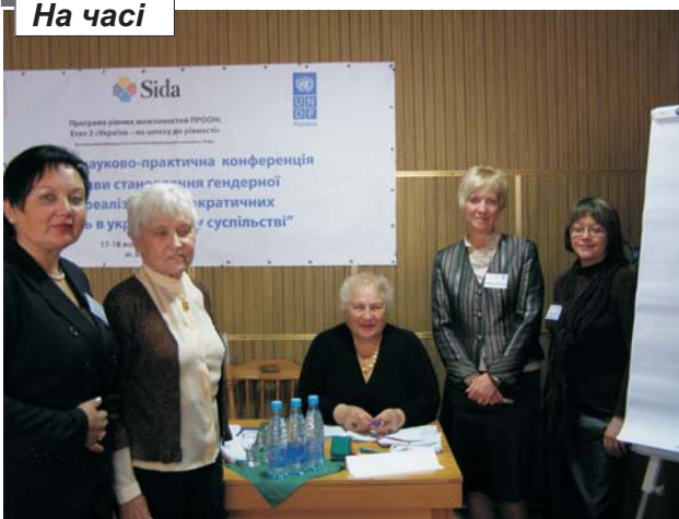
Мозковий центр гендерної освіти України і не лише України (друга ліворуч професор Університету Вальпараїсо (США) Мар'яна Рубчак)

Вінницький освітній гендерний центр відповідно до виконання проекту Програми Розвитку ООН в Україні (UNDP) з гендерної політики в рамках Програми рівних можливостей ПРООН провів Всеукраїнську науково-практичну конференцію «Перспективи становлення гендерної освіти як реалізація демократичних перетворень в українському суспільстві». Ідея проведення Всеукраїнської конференції саме на базі Вінницького освітнього гендерного центру виникла майже рік тому в Києві під час обміну досвідом в галузі гендерної освіти в Офісі Програми розвитку ООН в Україні та нагородження студентів нашого ВНТУ, що отримали призові місця у Всеукраїнському конкурсі наукових робіт з гендерної проблематики.