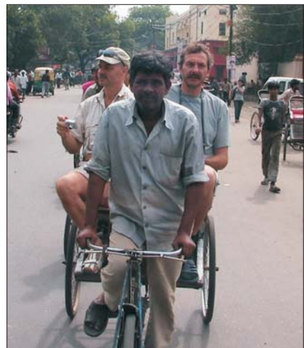
Рікша везе вінницьких туристів вулицями Делі

Нецивілізований трекінг. Самі прокладаєте маршрут, йдучи через абсолютно дикі джунглі, ущелини, ріки. Тут багато непередбачуваного. Приміром, на карті показано пунктиром, що є стежка по вершині, але насправді її нема. Це національний парк. Хижаків бояться не варт — їх майже немає.