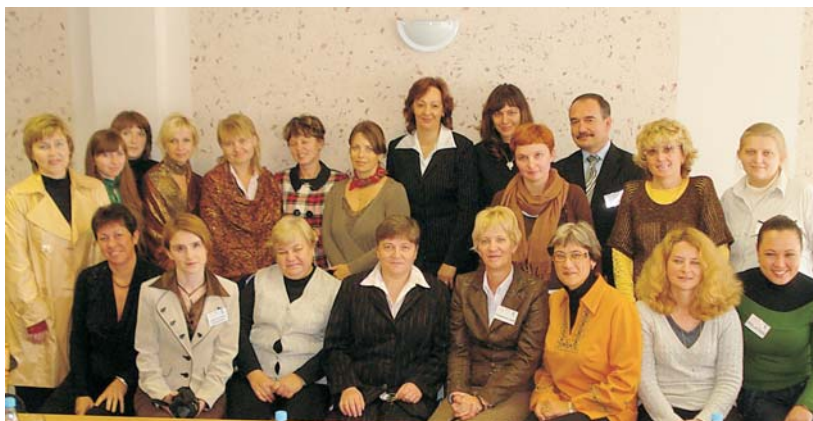
Учасниці і учасник конференції

кусями супроводжувалися обговорення доробків науковців в сфері адаптації світового досвіду в гендерній освіті до українських реалій. Загальна тенденція до формального