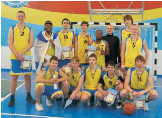
Наші «золоті» баскетболісти зі своїм тренером

Спортсмени нашого університету стали переможцями ІХ обласної універсиади з баскетболу серед команд ВНЗ III-IV рівня акредитації. І то вже традиція: торік баскетболісти ВНТУ теж здобули перше місце в цих змаганнях, перемігши «профі» — вихованців ВДПУ.