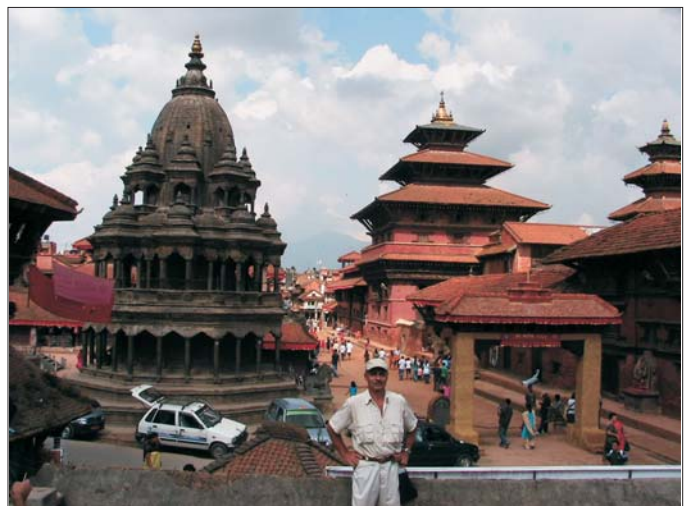
Патан — старий центр Катманду