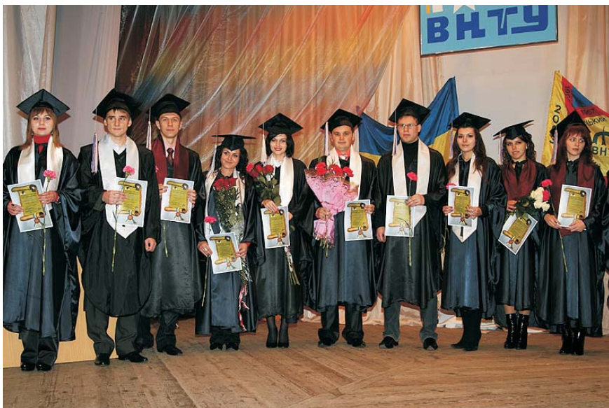
Почесні магістри нашого університету