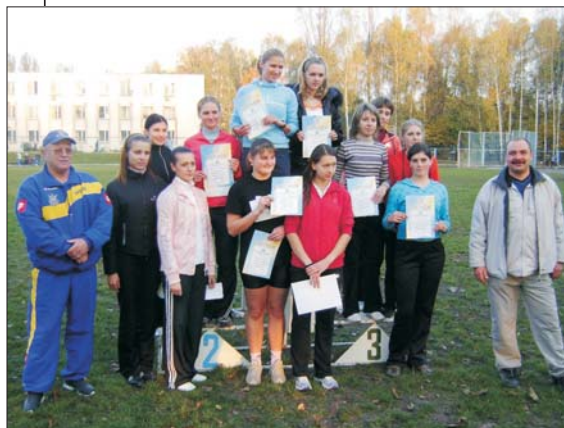
Переможці естафетного бігу 4x100.

Друге місце вибороли вихованці Інституту радіотехніки, зв'язку та приладобудування. Трете — Інститут менеджменту і екології та економічної і екологічної кібернетики.