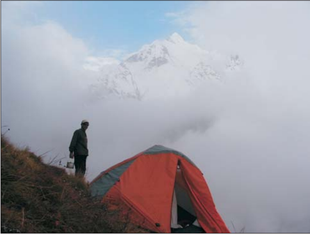
По-сусідськи з Мачупіча, пірамідальною вершиною, яка є однією з найкрасивіших у Гімалаях