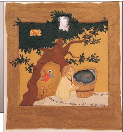
«Баба Принесла Води»

А митцеві подарунок — на сопліці першокурсник Інституту ЕЕЕМ (група