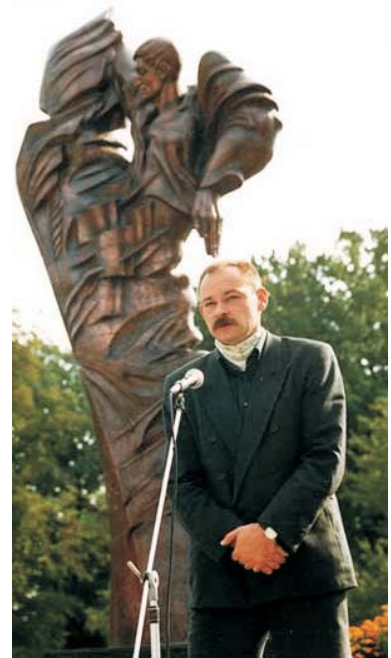
Поет і син поета

1991 Стуса посмертно відзначено Шевченківською премією.