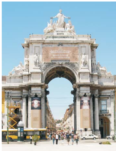
Лісабонська тріумфальна арка є зменшеною копією Паризької