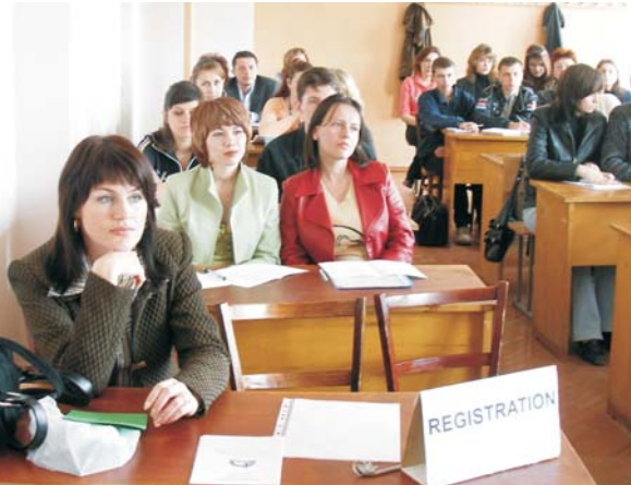
Засідання секції англійської мови

Сьогодні немає потреби когось переконувати в необхідності знання принаймні однієї іноземної мови. Спілкування людей світу на всіх рівнях у практично всіх сферах життя стає тіснішим з кожним кроком. Але попри всі технічні дива основою людського спілкування була і залишається жива природна мова, адже лише вона здатна передати всі відтінки думки, почуттів, характерів та стосунків співбесідників. Знання іноземної мови відкриває нові горизонти в освіті, кар'єрі, особистісному зростанні.