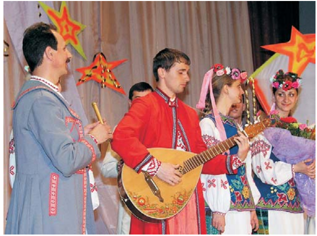
«Оберегівці» подарунок одразу випробували