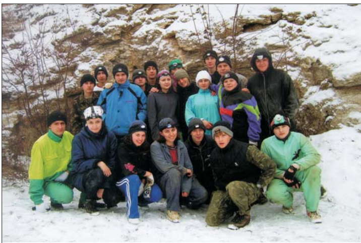
Ми — «Одіссей»

щити очі через яскраве світло нагорі, далі обливаєшся холодною водою, щоб змити із себе глину з печер, та відпочиваєш під справжню українську музику, яка постійно звучить у будинку, де ми мешкали, — розумієш, що задля відпочинку і задоволення не потрібно платити величезні кошти та їхати за кордон або на гірськолижний курорт.