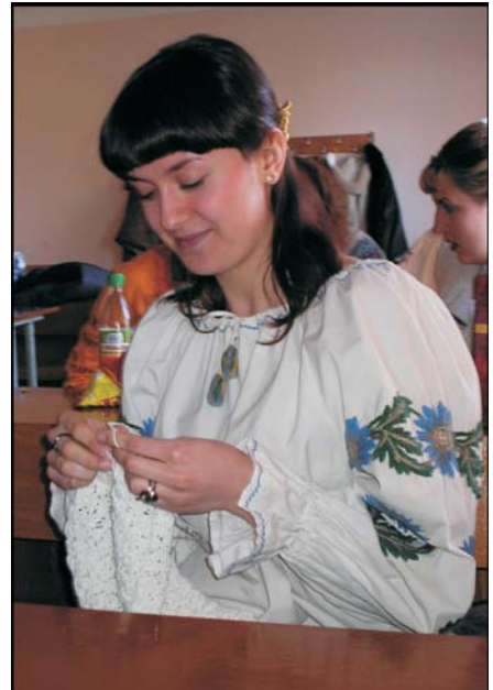
А я просто українка. Україночка

Але найнебайдужіша і національносвідома частина нашого студентства (з тих, хто читає оголошення) все ж одягнула вишиванки, не соромлячись привертати до себе увагу. Особливо активною була сама студрада, яка майже в повному складі була у вишиванках. Багато старост теж не проігнорували захід, за що їм велике спасибі. Шкода лише, що серед викладачів мало хто прийшов у вишиванках, але їм можна пробачити, адже тут, очевидно, дається взнаки те, що велику частину свого життя більшість з них прожила в умовах, коли за подібний захід можна було потрапити за ґрати, а ще русифікація... Але на мою думку, вишиванка — це не лише не соромно, а й престижно. Згадайте скільки народних депутатів носить вишиванки, згадайте літо, коли половина молоді була вбрана в сучасні вишиті сорочки.