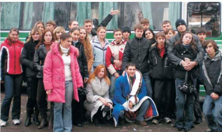
Студенти перед від'їздом у сиротинці

19 та 20 грудня студенти ВНТУ створили для дітей із сиротинців справжнісіньку казку. Нашому ректору, академіку АПНУ Борису МОКІНУ, який щороку підтримує акцію і надає університетський автобус, дітки передали рушничок, який вишили самі, і хліб-сіль як своєрідну подяку і побажання щастя і добра. А у малечі, за їх словами, з'явилася нова мрія – у майбутньому обов'язково поступити навчатися до ВНТУ і також допомагати іншим.