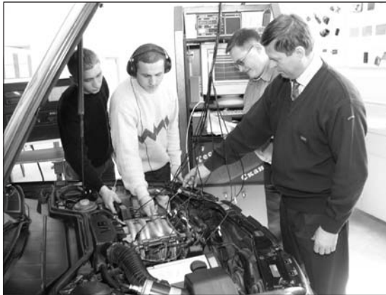
У Центрі діагностики та ремонту автомобілів завжди цікаво

гатьох країн світу. До наукової роботи залучаються також і талановиті студенти, які після магістратури можуть поступити до аспірантури. При інституті існує спеціалізована Вчена рада із захисту кандидатських дисертацій.