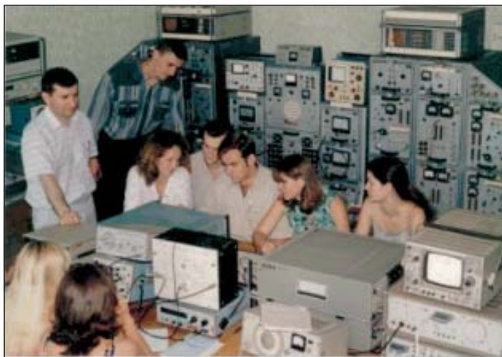
У лабораторії телекомунікаційних систем