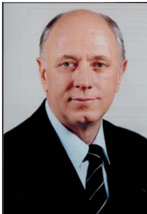
Директор ІнАЕКСУ — Відмінник освіти України, академік УТА, професор Анатолій Степанович Васюра

Кафедри автоматики та інформаційно-вимірювальної техніки та комп'ютерних систем управління готують фахівців за напрямом 0914 Комп'ютеризовані системи, автоматика і управління (кваліфікації: бакалавр, інженер та магістр комп'ютеризованих систем управління). Основний напрямок підготовки студентів спеціалізації 7.091401-01 Комп'ютеризовані системи управління та автоматики — сучасні технічні засоби персональних комп'ютерів; елементна база та схеми