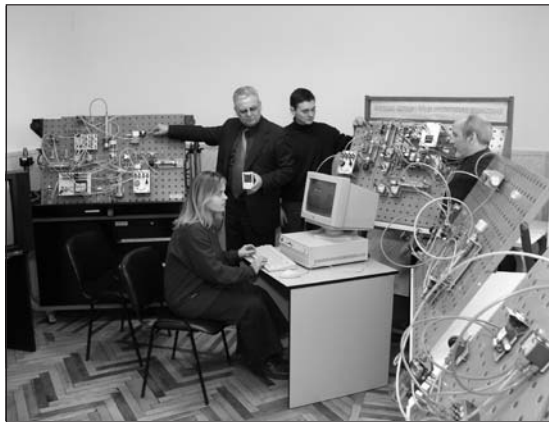
У Центрі мехатроніки «ВНТУ-ФЕСТО» моделюються інтелектуальні технологічні машини

Ученими інституту ведеться велика наукова і дослідно-конструкторська робота, розвинені наукові стосунки з ученими ба-