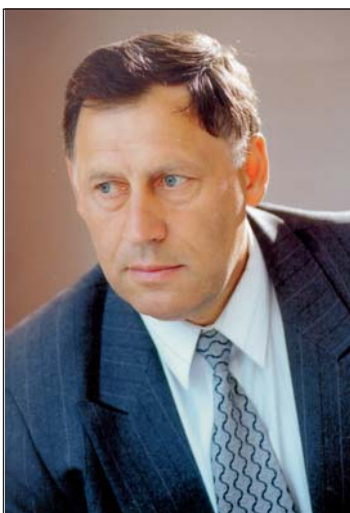
Директор ІНБТЕГП професор, академік Академії будівництва України Георгій Сергійович Ратушняк

Ряд нових технологій, конструкцій, матеріалів, машин і механізмів, які розроблені науковцями інституту, захищені понад 400 авторськими свідоцтвами та патентами. На базі Інституту