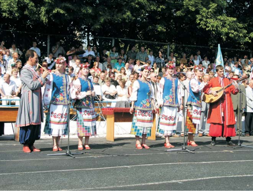
У добру путь з університетським «Оберегом»!

садою ми зобов'язані мати, хоча б уже для того, щоб було кому виконувати обов'язки декана у разі його хвороби чи відпустки. І, оскільки декан разом з директором інституту керуватиме усією організаційною, навчальною і методичною роботою факультету, то логічно було залишити декану лише заступника з виховної роботи, котрий перейматиметься гуртожитками і позааудиторною роботою зі студентами, братиме участь у роботі університетської ради з виховної роботи та допомагатиме органам студентського самоврядування.